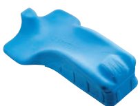
Cale de positionnement au lit P912L