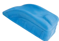
Cale de positionnement au lit P915L